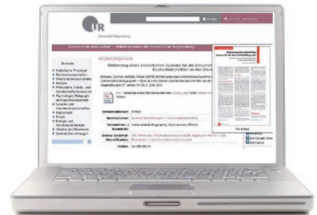
Finden einer Publikation mit der Dewey-Dezimal-Klassifikation