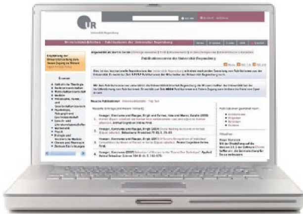
Startseite des Publikationsservers mit den neuesten Veröffentlichungen